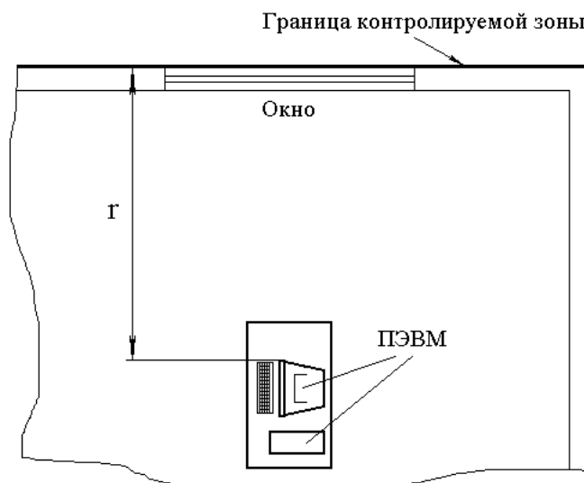
Рис. 1. Схема помещения для проведения расчетов

В соответствии со схемой (рис. 1) произвести расчеты защищенности помещения от утечки информации по электромагнитному каналу.