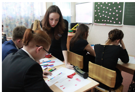
Внимание учителя - главное в обучении.