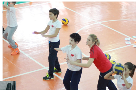
Любовь учителя творит чудеса!