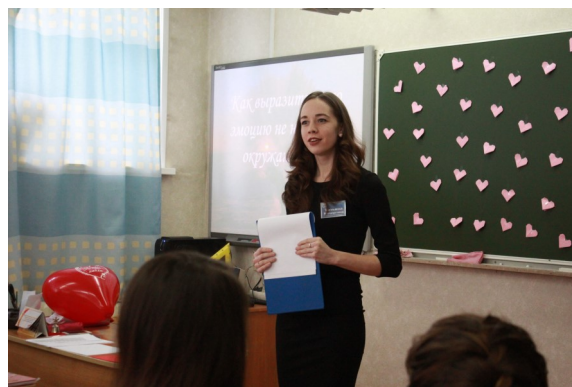
На уроке - только положительные эмоции.