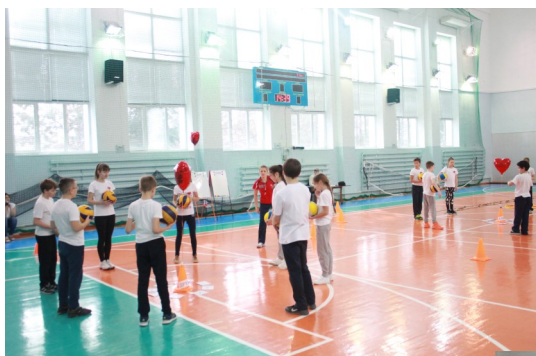
Командная игра объединяет.

- Хотелось бы попасть в число призёров. Знаю над чем нужно еще поработать. Всегда есть к чему стремиться!